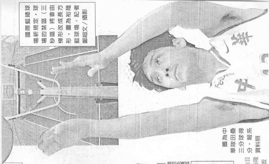
圖為中華隊田壘三分球得分。

國際籃總球 場新規定，球 場的禁區（三 秒區）將會由 梯形改成長方 形，圖為裕隆 籃球場。