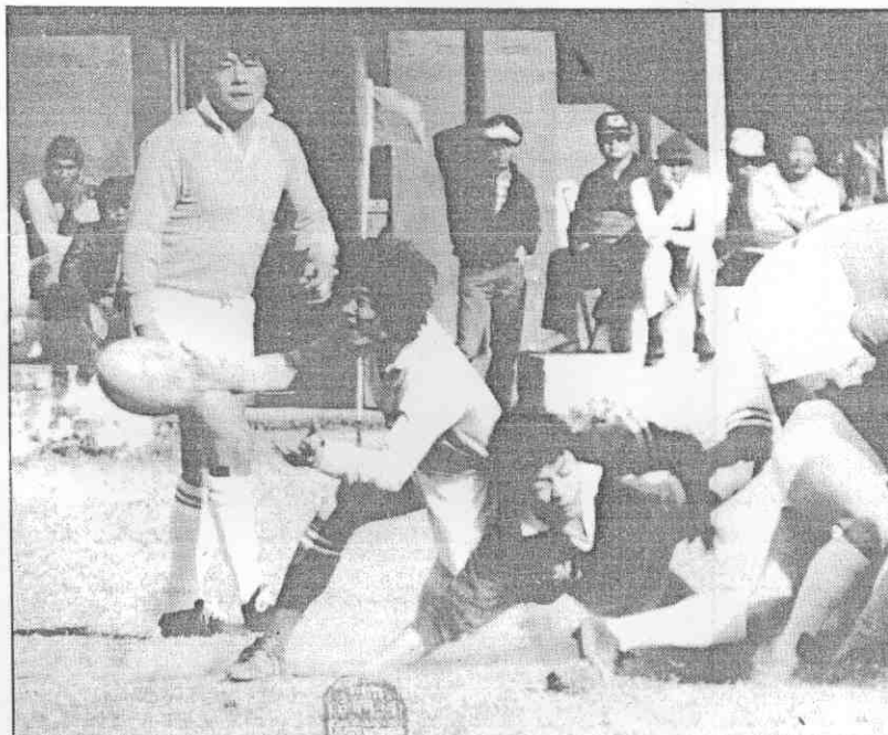
台灣區橄欖球賽陸光與茉莉花隊之戰，雙方傳鋒短兵相接。

淡水，十一時土城一新興，十二時五專組南台工專，崑山工專，十三時三十分高中甲組二信一建中，十四時四十分淡江一六信。