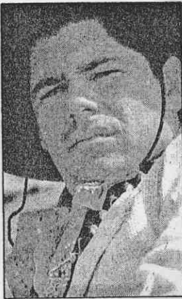
↑ 崔維諾29歲時的牛仔裝扮。→ 普來耶26歲時的模樣