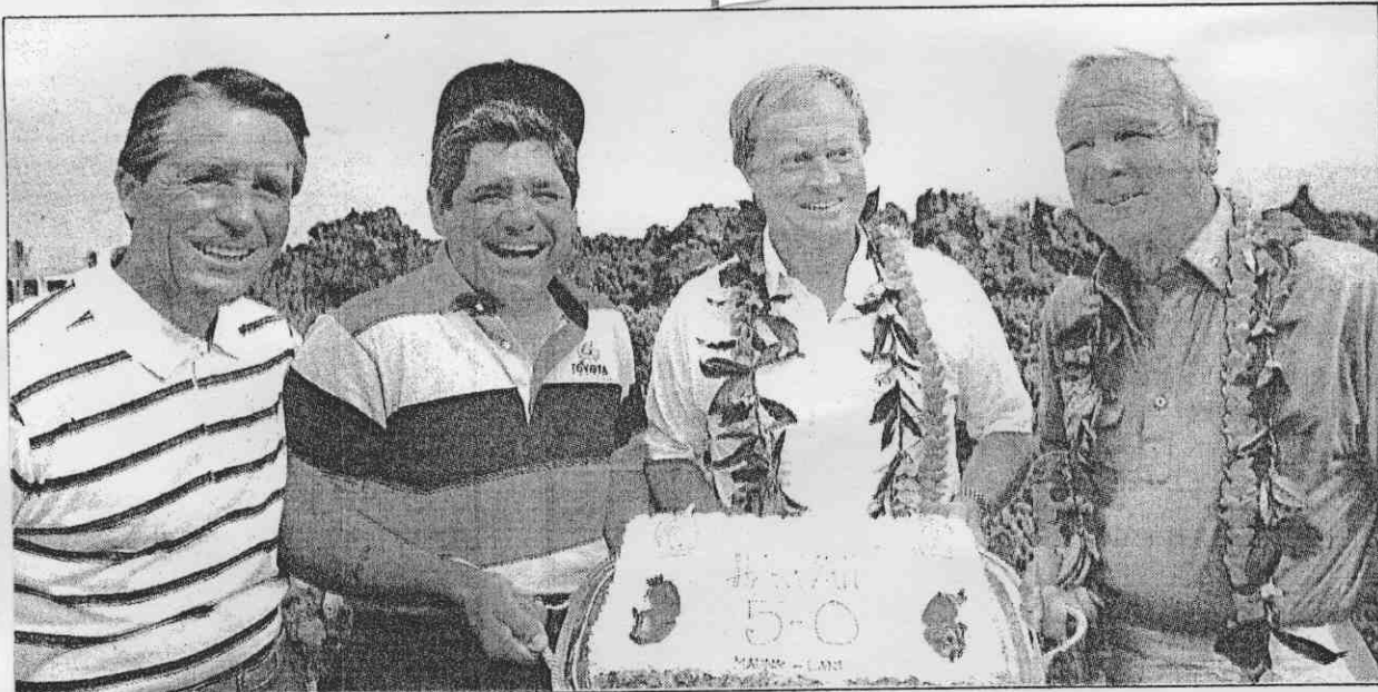
↑ 世界高壇4「老」天王(左起)普來耶、崔維諾、尼克勞斯、阿諾帕瑪，在夏威夷為尼克勞斯慶生。