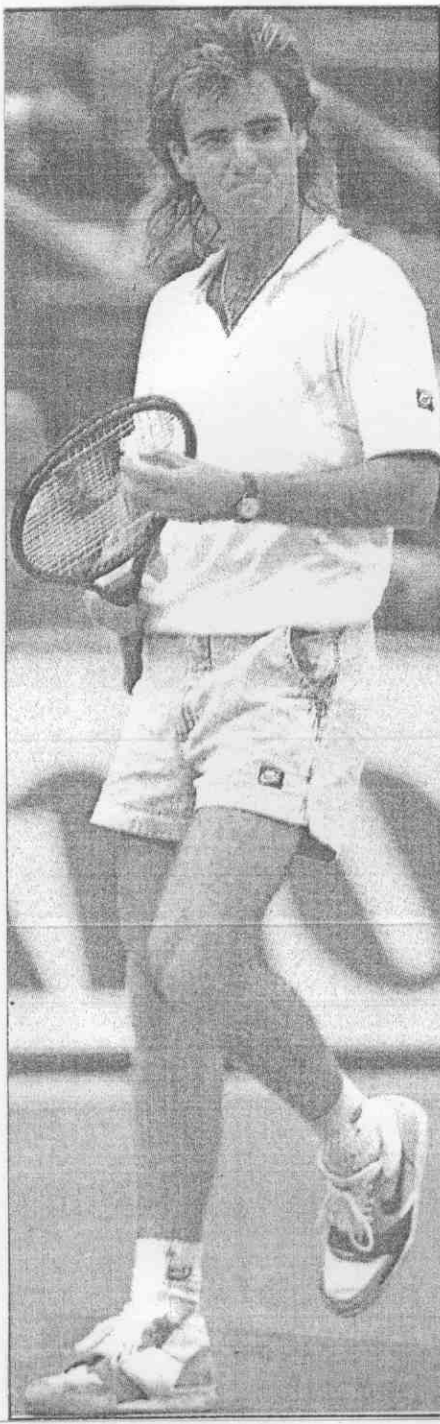
歲七西格阿▼ 就來拍起揮，時 。樣有模有