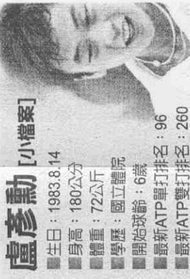
盧彥勳 [小檔案] ■生日：1983.8.14 ■身高：180公分 ■體重：72公斤 ■學歷：國立體育學院 ■開始球齡：6歲 ■最新ATP單打排名：96 ■最新ATP雙打排名：260