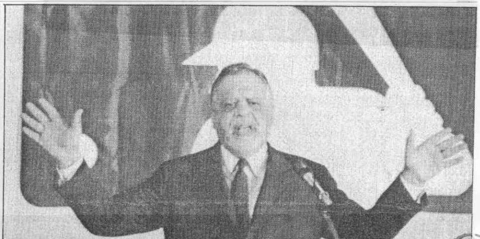
右圖：美國職棒總裁賈提馬在記者會上宣佈，對羅斯終身球監。 左圖：羅斯接受電訪，仍不承認賭博，但承認自己犯錯，也分合理。