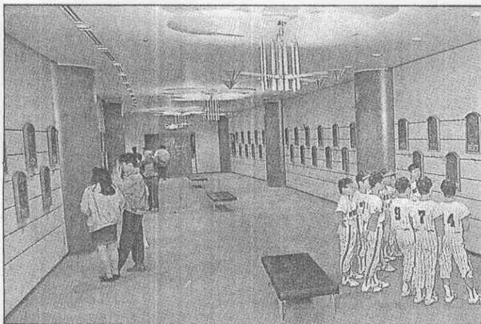
↑棒球博物館是東京「巨蛋」的一個重要據點。

室內球場的規劃與興建，絕非一件小工程，要將花費龐大又須有充分回收環境配合的室內球場，蓋在新開發的關渡平原上，這座室內球場的使用率、回收狀況及營運，應該會成為全球矚目的焦點。