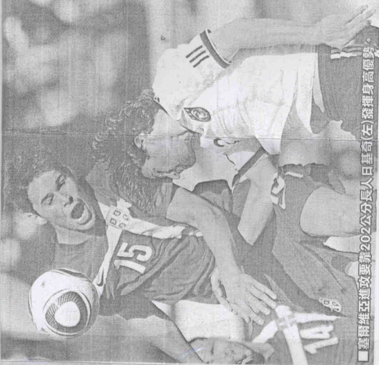
塞爾維亞進攻要算202公分長人日基奇(右)發揮身高優勢。

國際足總裁判事務負責人賈西阿蘭達(J.Garcia-Aranda)，昨雖給本屆裁判執法「非常非常滿意」的評價，但也舉出包括巴西vs.象牙海岸的手球、卡卡(Kaka)被判紅牌，以及美國vs.斯洛維尼亞被吹掉的關鍵1球(見圖)，執法都有問題，但他說：「國際足總不會對某一裁判的單一判決來單獨討論，有些判決或許不完全正確，但裁判也是人總會出錯，這是天性。」本屆執法裁判每人都能獲得5萬歐元(約195.71萬台幣)報酬。