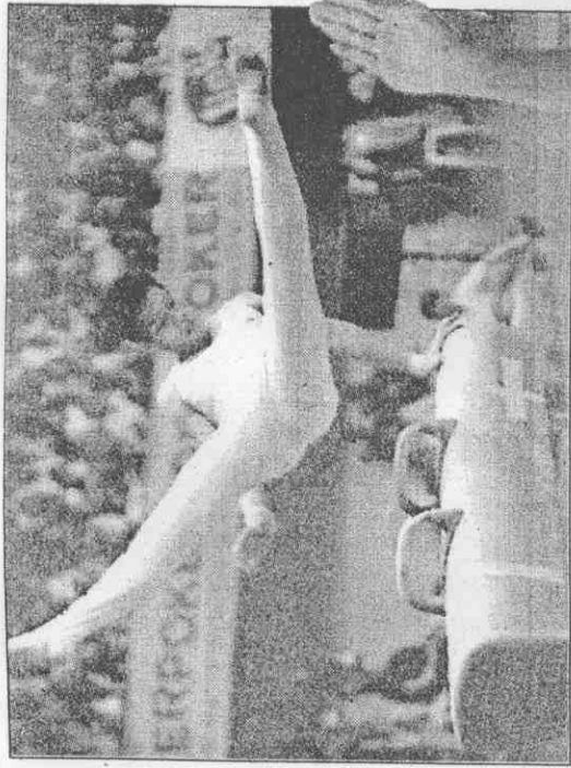
↑體操個人單項，中華吳金展鞍馬演出穩定，獲得銀牌。