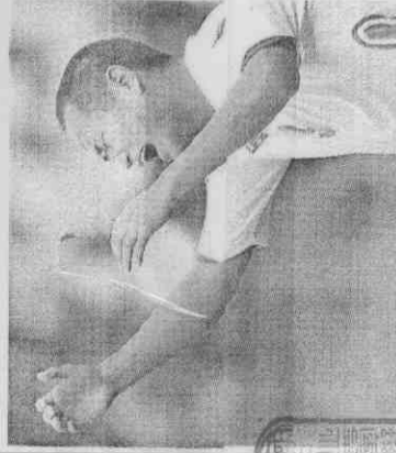
北韓大世在賽前演奏國歌時不再落淚，但看到球隊遭葡萄牙痛擊，在場中露出痛苦表情，卻無能為力。