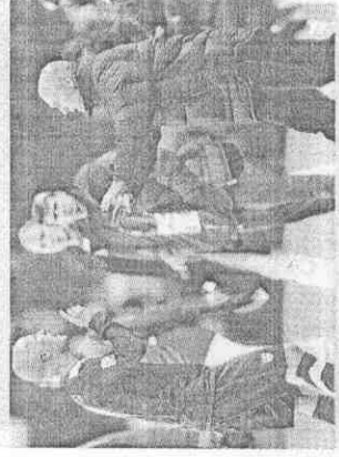
美國隊「光頭父子檔」包伯·布雷德利(右)與麥可·布雷德利(左)一同在南非世界盃努力，共度不一樣的父親節。