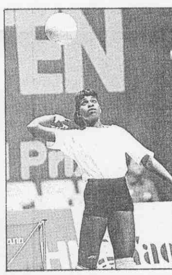
古巴的「跳人」露意絲首度來台，她是今年來台的頂尖運動名將之一。