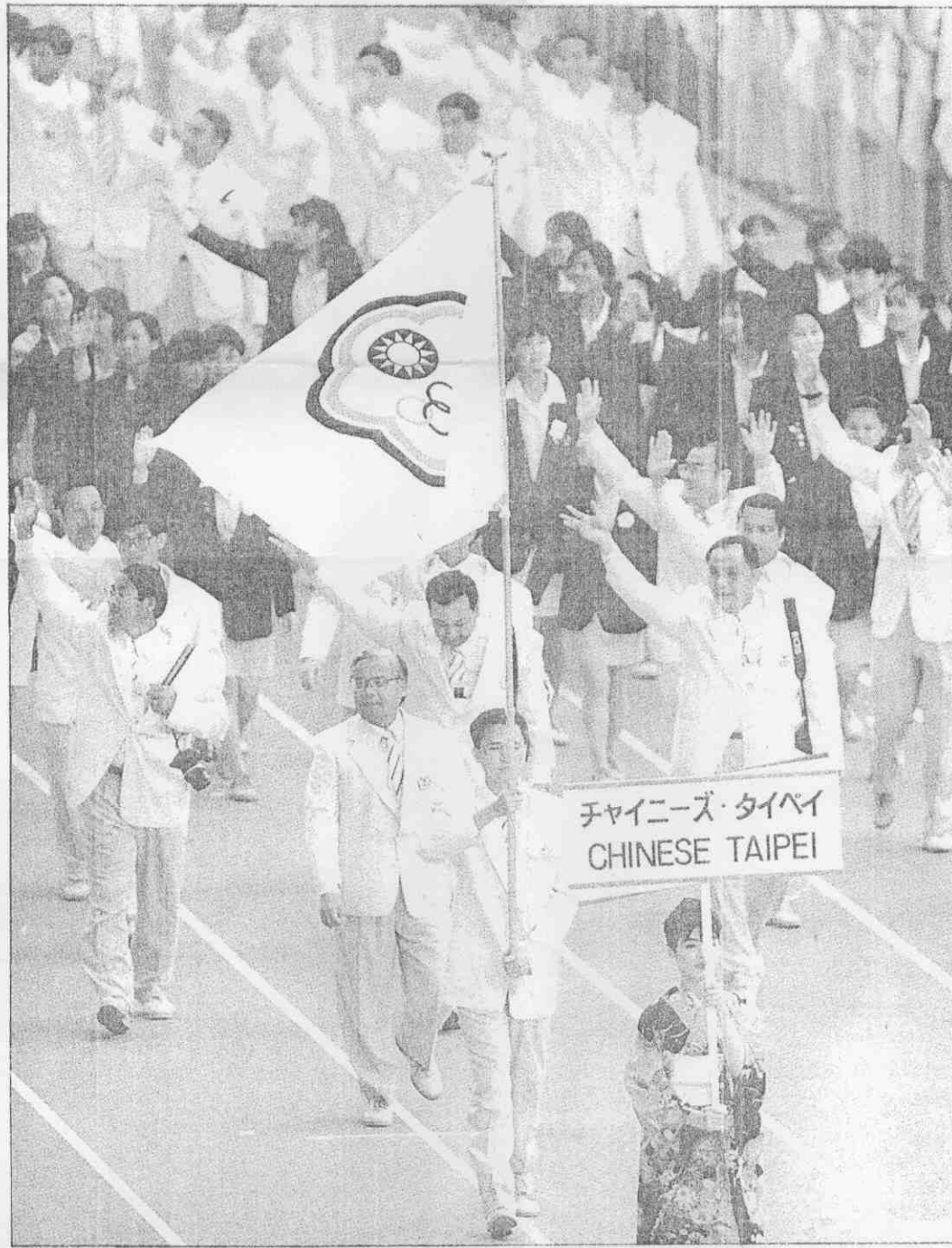
中華代表團在廣島亞運開幕典禮中進場，中華健兒將士用命，得到史上最佳成績。