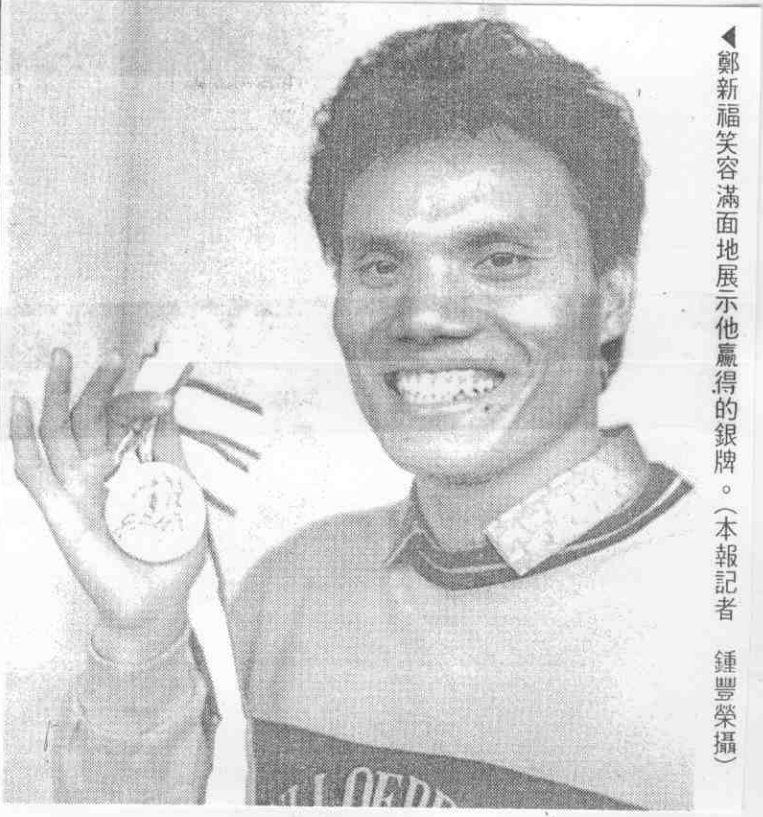
鄭新福笑容滿面地展示他贏得的銀牌。

曾經被封為「台灣劉易士」的我國短跑健將鄭新福，如今最心儀的對象，就是當前舉世最紅的加拿大飛毛腿強生。 去年羅馬世界田徑賽，鄭新福目睹了強生以九秒八三刷新世界紀錄的經過，對他佩服得五體投地。這天在練習場上，鄭新福逮到了和強生合照的機會，和強生站在一起，鄭新福突然變白了許多。 鄭新福希望三、四年後當他到了強生現在的年紀時，也能達到個人運動生涯的最巔峰。