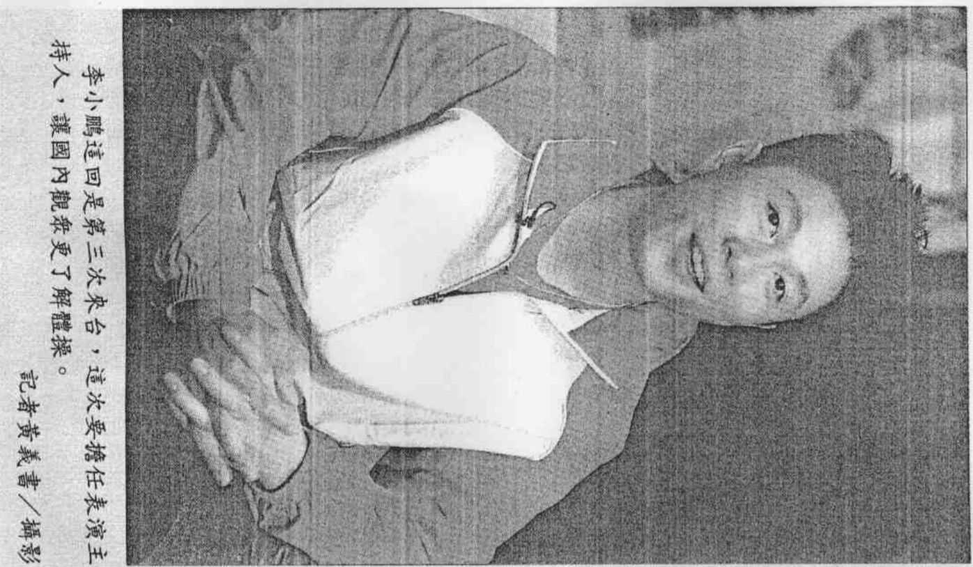
李小鵬這回是第三次來台，這次要擔任表演主持人，讓國內觀眾更了解體操。

【記者馬鈺龍／台北報導】第一用手比一下，他說：「有一種丸子很好吃」，經旁人提醒，原來「這回來台灣，還不知道有沒李寧，是大陸最多世界冠軍頭銜的體操選手，他很謙虛地說，「我還是最喜歡的還是台灣小吃，他說：「前兩次來吃過不少，這次有機會，還是要再品嚐一下。」