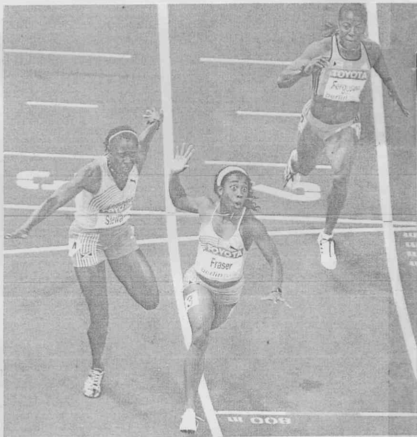
▲牙買加女將芙蕾瑟一馬當先衝過終點線，摘下女子百米金牌。