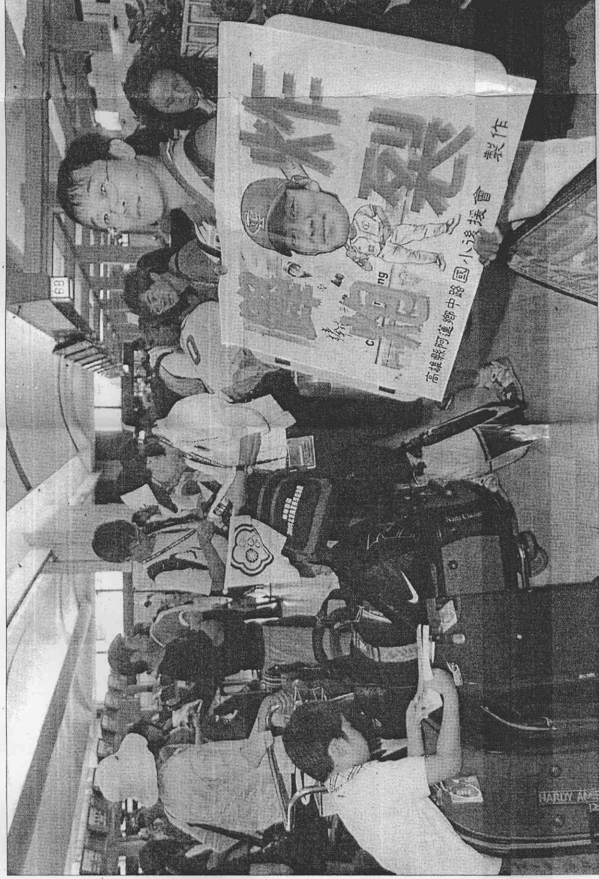
▲時報旅遊2008北京奧運中華棒球加油團12日上午自桃園機場出發。預計來自全台超過五百位民眾，今起將在北京為中華台北棒球隊加油。

大會技術委員並沒有完全遵照星野的提議進行處理，不過，當場「動之以情」呼籲各參賽國家：「大家同在球界很久了，都是棒壇的一分子，比賽時還是要有運動家的精神，不要有傷和氣的舉動。」