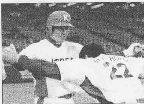
▲南韓李承煒擊出全壘打，隊友向他行大禮。

除了林智勝，詹智堯、張家浩、葉君璋等球員也都在一旁細心欣賞鈴木一朗的打擊練習，林智勝還趕緊向朋友借來相機拍照，而且還是Ichiro揮棒的連續動作，他說：「回去再慢慢研究。」