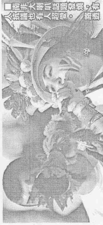
南非大喇叭話題發燒，有抗議也有人超愛。(詹遜)