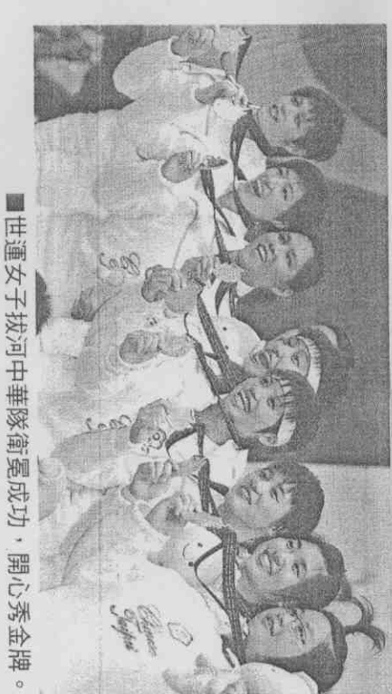
世運女子拔河中華隊衛冕成功，開心秀金牌。