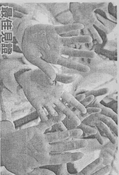
最佳見證 中華女子將伸出雙手，每隻手都是苦練產生的厚繭。

【威海倫、黎建忠／高雄報導】2009高雄世運中華隊再傳捷報！昨在女子拔河、競速溜冰及健美比賽中，再添2金2銀1銅，目前中華代表團共以5金4銀2銅成績，僅次於俄羅斯暫列第2名。