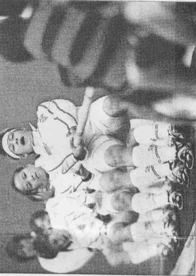
▲上屆世運女子拔河賽，中華隊獲金牌。

申辦奧運成功可為城市帶來華麗的建設，增建許多場館、道路，也會加快體育國際化腳步，增加城市及國家的榮譽，大台北區民眾都很興奮，希望美夢成真。