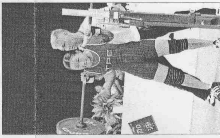
▲世運的健力比賽，中華女選子在這個項目很強。