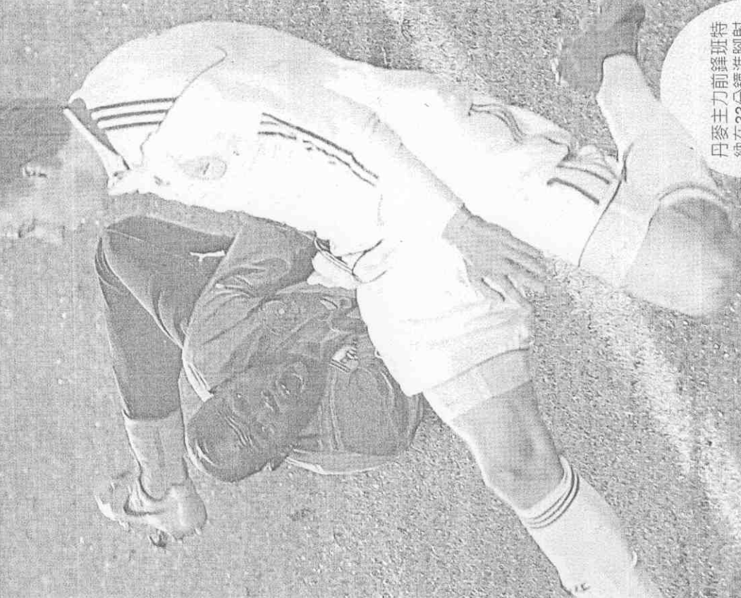
丹麥主力前鋒班特納在33分鐘進射門，踢進追平比數的關鍵一球。(路透)