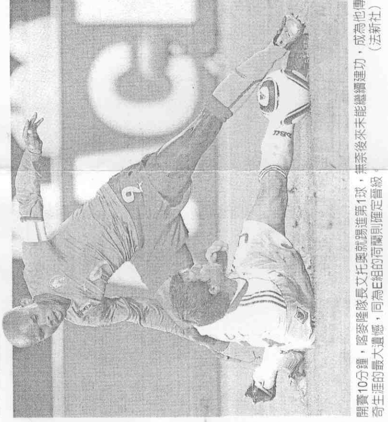
開賽10分鐘，喀麥隆隊長艾托奧就踢進第1球，無奈後來未能繼續建功，成為他傳奇生涯的最大遺憾，同為E組的荷蘭則確定晉級。

丹麥中場羅梅達爾憑藉過人腳法，在右路接到隊友傳球後，一路直搗禁區，閃過喀麥隆防守球員，起左腳射門，門將哈米多無法招架。