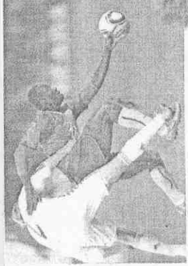
喀麥隆中場伊安(右)實力搶球，把丹麥C.波爾森擋在身後。