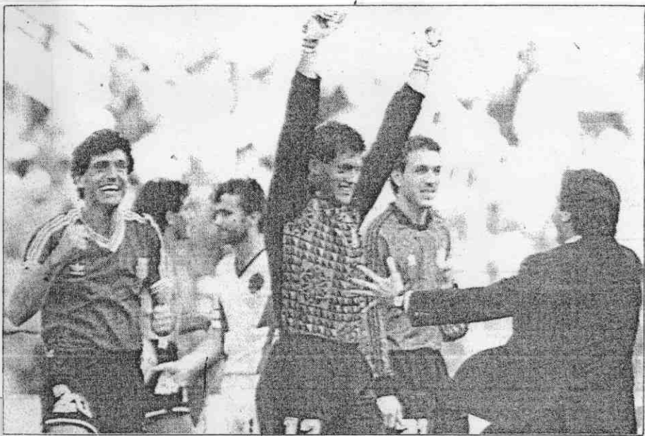
↑阿根廷門將戈伊格查30日在連續撲下南斯拉夫兩次12碼球，為阿根廷贏得勝利後，高舉雙臂，並接受隊友的歡迎。