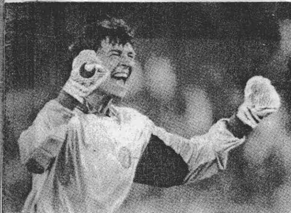
↑義大利門將任卡在希拉奇射門成功後，興奮地握拳開懷大笑。