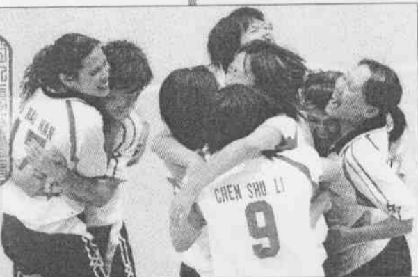
▲中華女排擊敗大陸，隊員興奮地抱成一團。