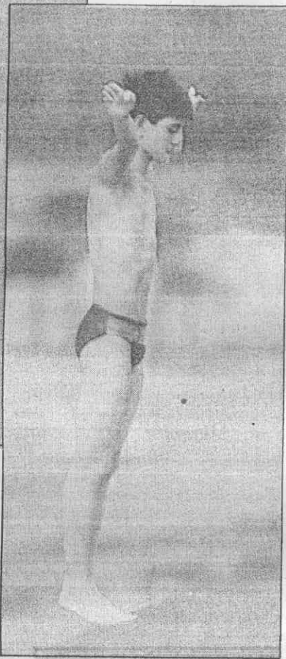
↑熊倪的高台跳水技藝高超。