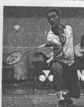
球質不夠重是他最大的弱點。 ↑男單簡佑修具有優異的防守能力，但進攻