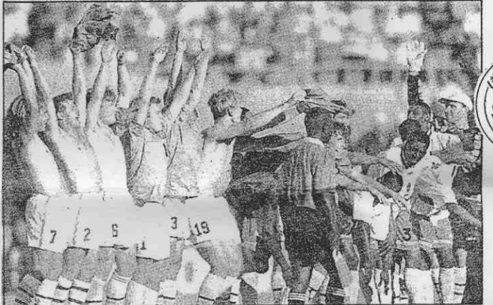
↑瑞典球員排成一列，作波浪擺動。旁邊的喀麥隆球員後來也模仿他們的動作。

假如玻隊未能打進第二回合，則艾契維利的本屆世界杯參賽時間將只有他在首場從入替到被罰出場之間短短的四分鐘。