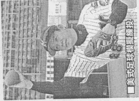
■美式足球模擬練投

麼多年的確有他的一套，前幾年在一軍時也想過邀請這位學長來幫忙，沒想到這次真的有機會再遇到他。」