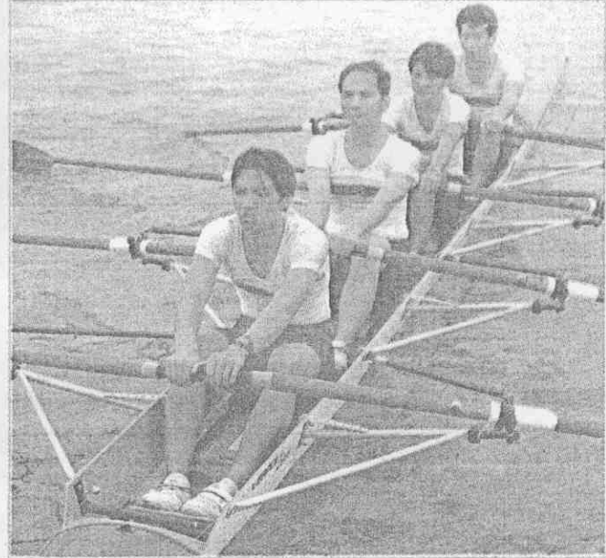
↑區運划船賽四人雙槳無舵式，宜蘭縣長游錫堃(左二)親自操槳。