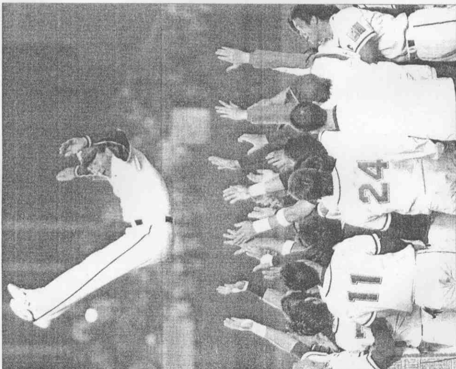
奧運棒球資格賽中、韓大戰，中華隊以3比4吞敗，但仍漂亮打進奧運，球員高興將總教練頭高拋慶祝。

中華隊此役共吞十二次三振，洪總表示，韓國的投手戰力是八強最強，無論控球或球速都很好，中華隊得到三分不算太差，也會好好研究對策。