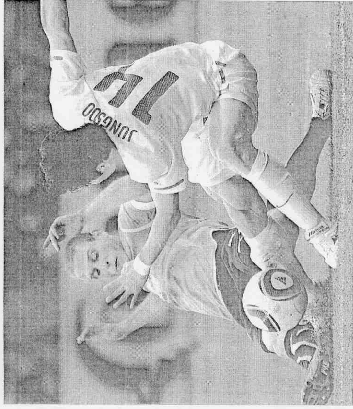
▲南韓隊忌諱穿全白的球衣，果然在16強賽輸給烏拉圭。

南非警方表示，偷走球員物品的作案者是5名飯店的雇員，稍後，警方搜查了這5名雇員的家，起出