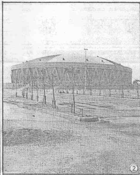
。材枝出長已樹大的栽植④。台看廣寬的人千六萬一納容可③。立轟然麗館育體合綜②。幕示顯子電①

【本報訊】矗立在林口中正體育園區的綜合體育館，全部工程都已完工，這座國內規模最大、設備最現代化的室內體育館，將在國慶日首度啟用。 這座耗資八億元的綜合體育館，是由台塑關係企業董事長王永慶捐獻的，從民國七十年七月動工興建，費時五年多才完成全部建設。 綜合體育館座落在中正體育園區的最北端，也就是整個園區的入口處，佔地一點四公頃，整體建築相當於十五層樓高，可容納一萬六千人，比現在的中華體育館大百分之五十。體育館中間的競賽場地，可以鋪設一條周圍二百公尺的四道跑道，並且完全符合國際田徑協會對室內田徑場的要求，外道有一定的傾斜度，在這座室內田徑場所創的紀錄，也會被國際間承認。 同時，體育館還可進行多種運動比賽，如籃、排、網、羽、桌球等球類比賽，體操比賽以及柔道、空手道、跆拳道、拳擊、擊劍等技擊比賽，並依比賽性質更換裝多用途活動地板，最大鋪設尺寸足夠作為兩個籃球場。 體育館內上下兩層看台，下層看台是一個規則的橢圓形，有四千八百多個座位，這些座位都是活動的，可隨比賽項目收卸安裝。上層看台則是漂亮的元寶弧形，兩側較低，中央較高，有一萬一千多個座位，所有座位都有扶手及靠背，坐起來非常舒適。 館內採用中央冷氣空調系統，並設置新聞電視轉播、大型彩色動態、靜態電腦顯示幕，可隨著比賽的進行，透過顯示畫面，傳達給在場觀戰的觀眾。 體育館的動線設計完全基於安全的考量，觀眾從六處寬敞的出入口進去後，必須先通過圍著體育館的環形大廳，才能進入體育館內。 觀眾進出體育館的位置，是在觀眾席的中層，選手則從體育館的底層進出，有秩序的離開觀眾及選手的接觸。 體育館四周圍有高抗壓的透明玻璃，當幕簾拉開時，可以清楚看到周圍的環境，以及支撐體育館的四十八根V型鋼骨混凝土結構。 這座合乎國際標準的室內運動競技場所，預定在本月底交由中正體育園區籌建委員會接管，並提供國內各項運動比賽及大規模集會使用。