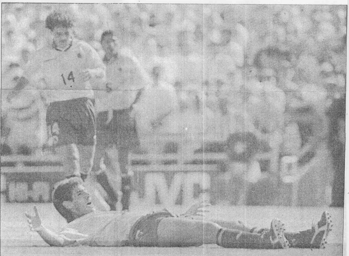
↑遭槍擊死亡的哥倫比亞足球選手艾斯科瓦(倒地者)

國際足球總會發言人赫倫表示，國際足球總會對此消息感到震驚，人人錯愕不已。國際足球總會預定在二日稍後發表正式的聲明。