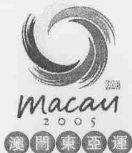
←澳門東亞運昨晚閉幕，典禮上表演『東亞和風』，歌頌體育運動的力與美。