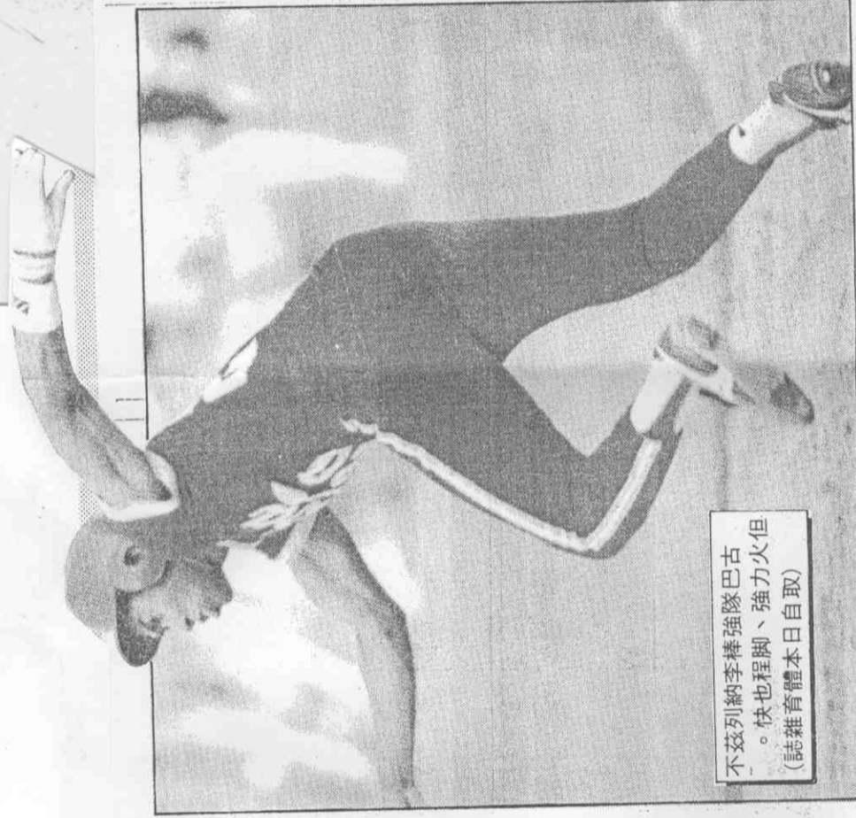
不茲列納李棒強隊巴古。快也程脚、強力火但。(誌雜育體本日自取)