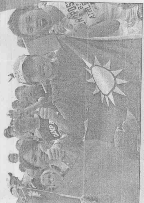
↑↓華府地區留學生專程到威廉波特為中華少棒隊加油，小球賽後向觀眾席脫帽致意。