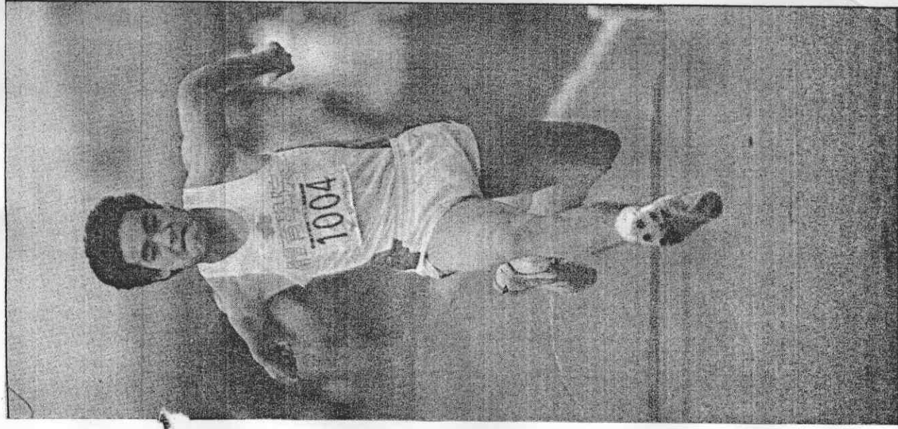
↑ 乃慧芳在三級跳遠奪魁，但成績並不突出。