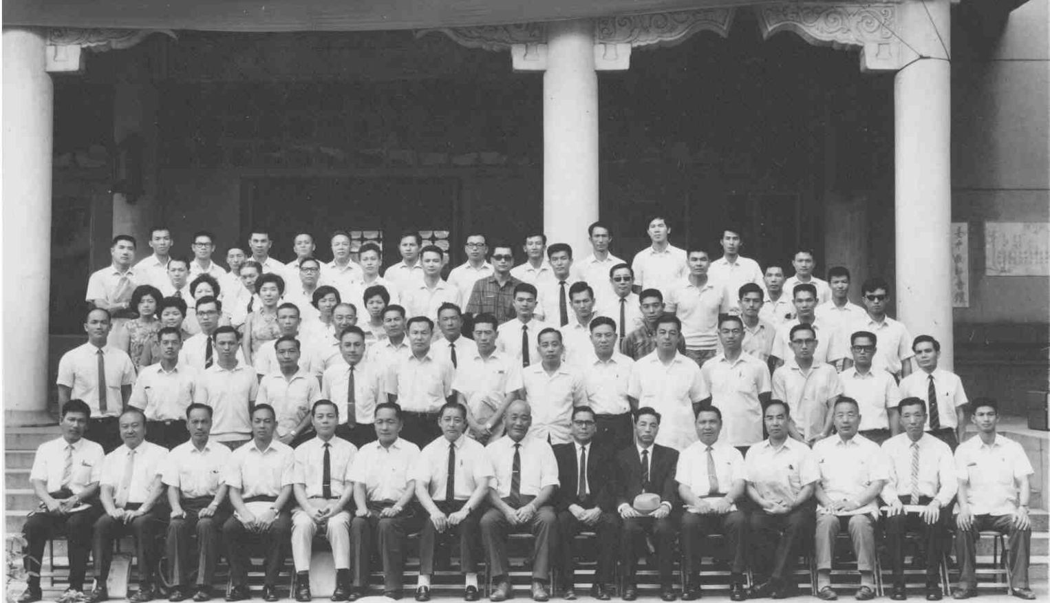
中華民國五十九年九度全國專大院校體育總會暑期體育學術研討會攝影會青（省立體育主辦）