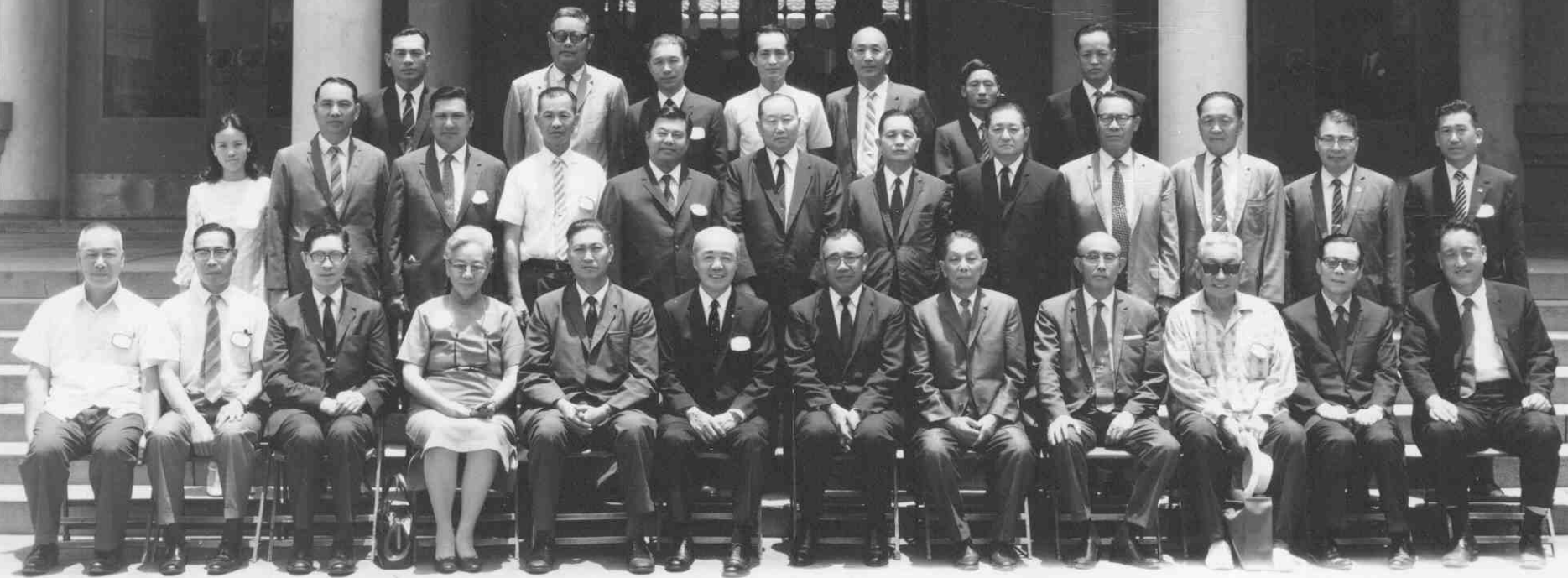
中華民國十六年六月廿二日 于台中師範會館 臺灣省國民體育委員會全體顧問 合影紀念