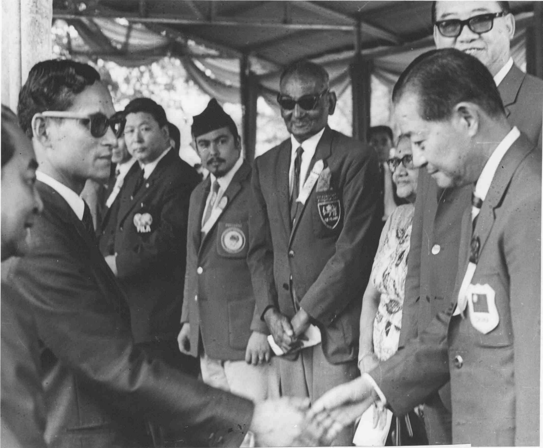
民國 59 年 11 月在泰國曼谷第六屆亞運會與泰王蒲美隆握手