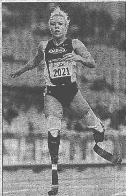
↑23 日美國的柯瓦特以超越世界紀錄 3 秒的 28 秒 52 成績，奪得雪梨殘障奧運 T44 級義肢組兩百公尺金牌。