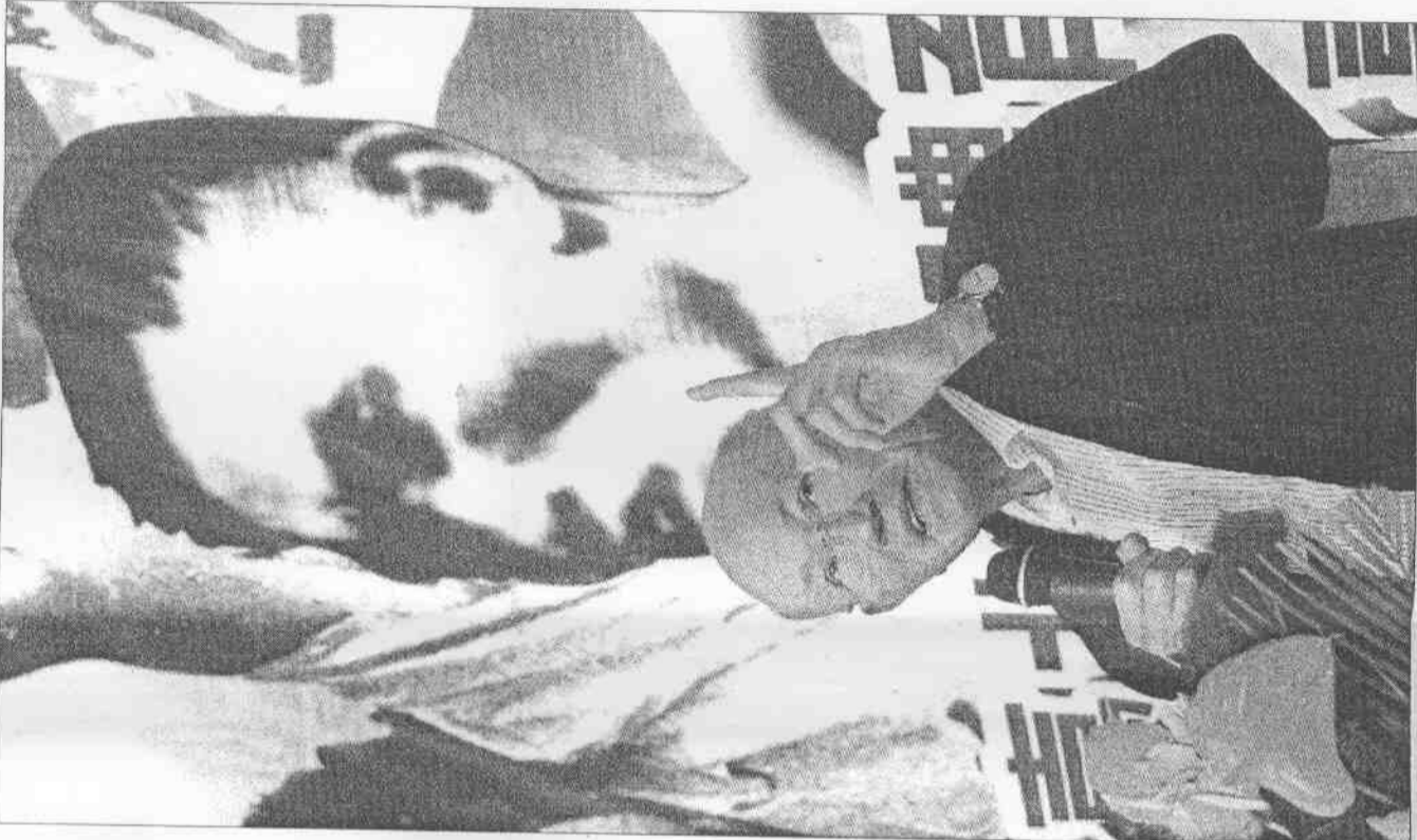
十項鐵人楊傳廣走了。去年他在應邀出席台北市立體育場懷舊記者會時，仍然神采奕奕，述說著當年的黃金時代，留下的是在羅馬奧運運籌帷幄的無盡的回憶。本報資料照片