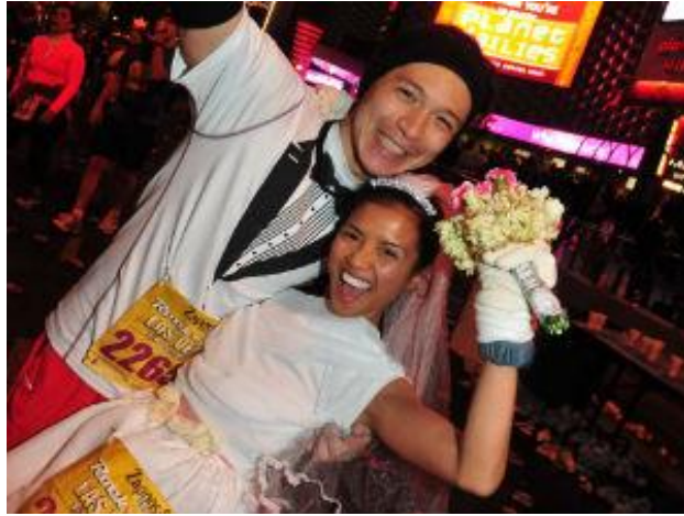
圖 2：外國 Rock`n` Roll Marthon 比賽 Las Vegas 站，馬拉松婚禮。