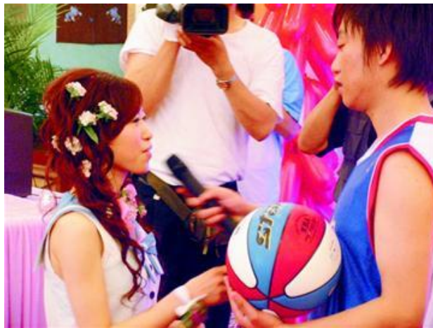
圖 4：大陸新人，舉辦籃球婚禮。

籃球場不但可以是打球的地方，也可以是完成終身大事的禮堂。在高雄市有兩對熱愛籃球運動的情侶，戀愛成長過程中總少不了籃球的陪伴，因此當彼此決定要結婚時，而婚禮的地點，當然就選在最愛的籃球場。完成婚禮的方式，也是用籃球的方式完成結婚儀式。婚禮中的花僮，成了球僮。而常見的「紅繡球」，也改成了「籃繡球」，於是在眾人的祝福下，完成終身大事的籃球新人，希望婚姻生活能夠像所熱愛的籃球一樣，圓圓滿滿（數位典藏與數位學習成果入口網，2012）。