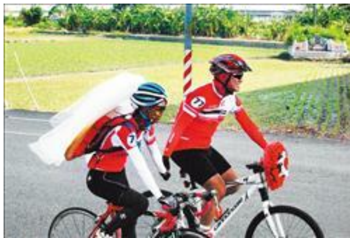
圖 3：雲林單車婚禮，新娘出嫁時。

而是緊身的自行車衣，連訂婚時新娘端茶、男女雙方互戴戒指時也都如此穿著。在傳統禮俗中，女孩在出嫁時，必須請長輩用米篩遮住新娘的頭，因此這位單車新娘頭戴白紗，但必須自己騎車，因此只能仿效忍者龜，將米篩背在背上，象徵傳統的米篩遮頭，親朋好友見了都拍案叫絕，覺得這對新人真的創意十足。這對新人在單車婚禮過程中，不時雙手緊握，恩愛有加（詹士弘，2009）。