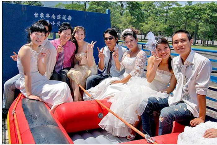
圖 11：臺東卑南溪泛舟婚禮。