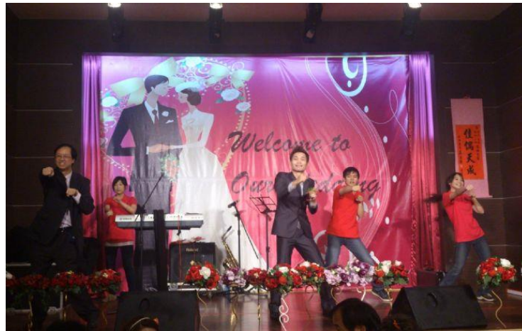
圖 6：桃園健康瘦瘦拳婚禮。