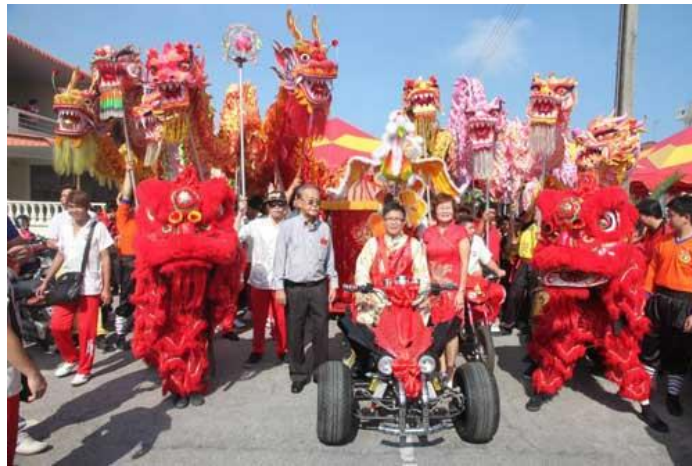
圖 8：氣勢磅礴的舞龍舞獅迎親團。

娶新娘，場面極為浩大，而出動的舞龍舞獅團體包括當地北海鬥母宮龍獅團、大山腳華光大帝龍獅團、北海龍坤體育會和等。有兄弟會團圓的撐腰讓整個婚禮場面好不熱鬧，所到之處也引起不少民眾的圍觀，大家都被這氣勢磅礴、熱鬧非凡的婚禮給吸引，頓時也成為了街坊鄰居的飯後話題（新華網，2012）。