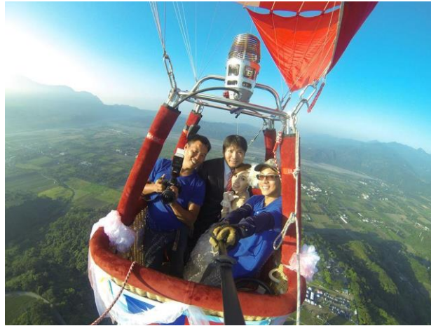
圖 16：臺東熱氣球婚禮。

外還是覺得很幸福及幸運，因為在歷經這場意外後他們還能相守在一起，沒有因此而拆散，而且未來還能夠將這段婚禮驚險記說給孩子聽。而這場幸福又驚嚇的婚禮也成為他們一生中最永難忘懷的回憶（華視電視公司新聞網，2013）。