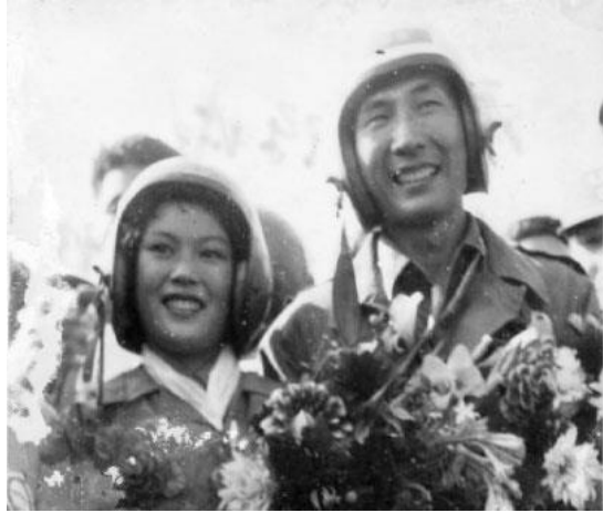
圖 13：1959 年跳傘婚禮。