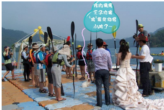
圖 10：新人於日月潭舉辦獨木舟婚禮。

旅遊名勝景點一日月潭，訪客來到日月潭不是選擇搭乘遊艇，就是騎乘自行車漫遊日月潭湖畔等，但鮮少人知道日月潭也是可以划獨木舟。獨木舟婚禮的新人是同一獨木舟推廣委員會會員，而現場所有佈置更是推廣委員會之同伴一手包辦。這場婚禮特別之處除了在日月潭舉行外，婚禮中的任何儀典程序都與獨木舟脫離不了關係，從新人進場，特別的船槳拱門，以及要娶得美嬌娘所進行的過五關斬六將之關卡，每一關卡皆需要使用獨木舟來進行完成，過五關斬六將完後迎娶之路也是靠獨木舟之划行，甚至最後新人在丟捧花時，親朋好友也都要划獨木舟去搶捧花。俗語說：「一個銅板敲不響」如此特別的婚禮，一定是要兩人都有共同的愛好才有辦法達成，期待出現更多特別的水上運動婚禮（臺灣獨木舟推廣協會，2009）。