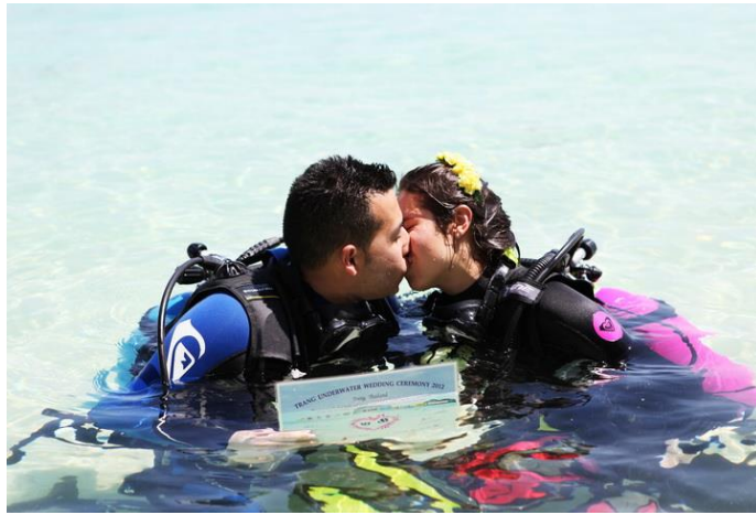
圖 9：泰國集體潛水婚禮。

資料引自：The 16th Trang Underwater Wedding Ceremony (2012)。