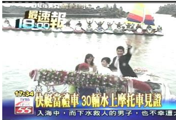
圖 12：水上摩托車婚禮。

臨。快艇的後頭跟著水上摩托車迎親團，緩緩的送快艇出港，也送上滿滿的祝福（劉欣達，2007）。