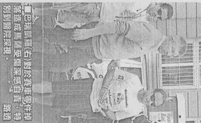
巴瑞凱羅(右)對於賽車零件掉落造成馬薩受傷深感自責，特別到醫院探視。

針對這項處罰，雷諾車隊已經繳交60000歐元(約28萬台幣)上訴保證金，爭取本季還剩下7站的出賽權。