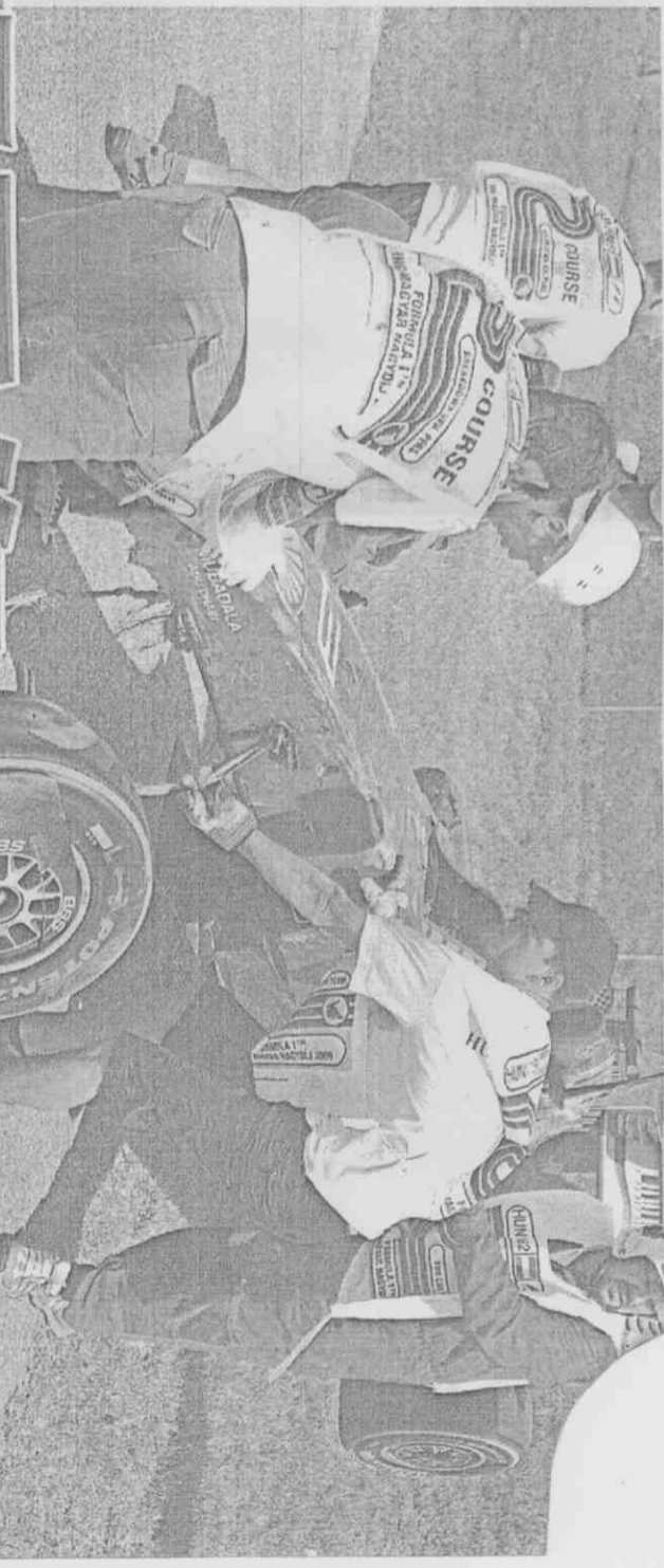
馬薩駕駛法拉利賽車以時速200公里撞擊護欄後，車體殘破不全。