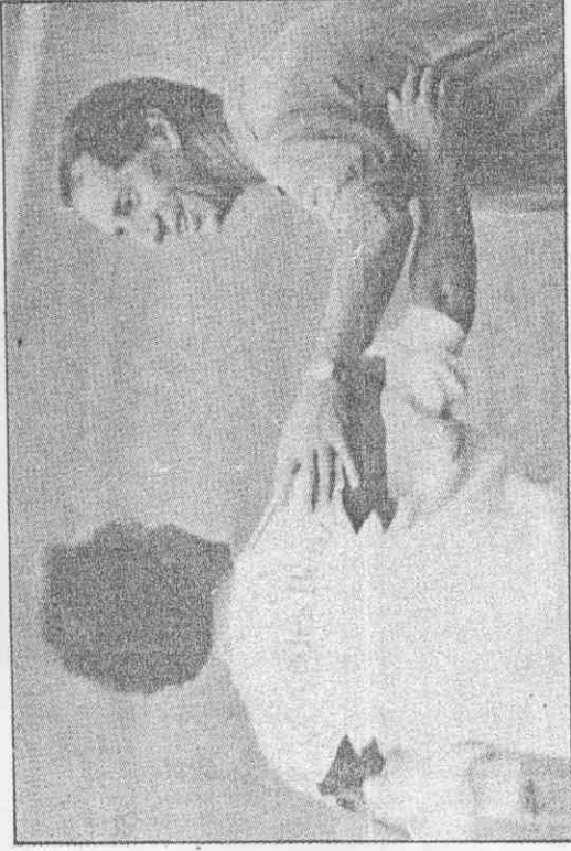
上左：西德教練碧根鮑華(左)和阿根廷教練比拉度(右)在兩隊交手前夕，相互致意，先禮後兵。 上右：西德足球隊長馬泰斯(左)與阿根廷隊長馬拉度納(右)7日在羅馬奧林匹克運動場練習碰面時，互相擁抱打招呼。