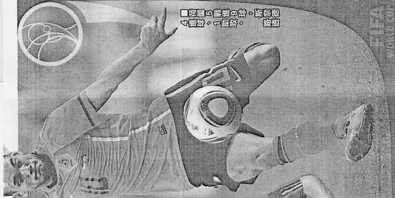
荷蘭5戰進9球，斯奈德4進球，1助攻。