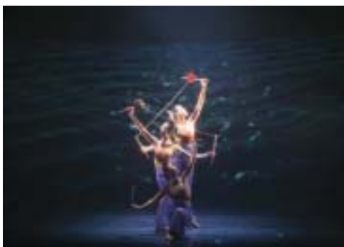
「海洋之心」表演劇照

舞鈴劇場的製作團隊嘗試與國內外不同領域的藝術家合作，團員除了接受扯鈴的專業訓練外，還接受包括芭蕾、身段、體操和音樂節奏等訓練。除了必須精於各單項技巧外，更必須將所有技巧融合為一，形成獨特而創新的表演型態，稱之為～舞鈴（Diabolo Dance）。舞鈴劇場受邀於紐約林肯中心、臺北國家戲劇院、加拿大蜂鳥劇院、日本愛知博覽會及國內外藝術節，獲得熱烈迴響與肯定。