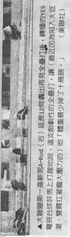
▲大聯盟第一高薪男A-Rod (右) 延長12局轟出再見全壘打後，轉播的YES電視台評馬上打趣地說：這支戲劇性的全壘打，讓 (最近因為陷入大低潮、雙肩扛著龐大壓力的) 他「體重最少掉了十幾磅。」