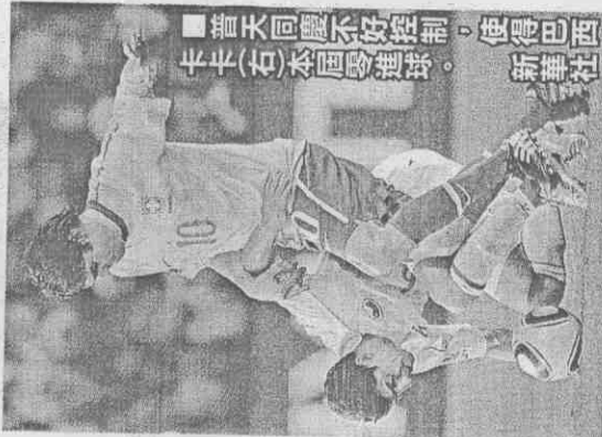
普天同慶不好控制，使得巴西卡卡(右)本屆零進球。

足壇新霸主西班牙在7場比賽才踢進8球，成為史上進球數最少的冠軍隊，而且有5球集中在畢亞(D.Villa)身上，之前進球數最少的冠軍隊為11球。西班牙連續4場比