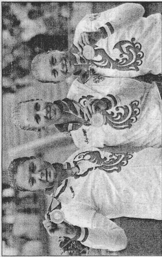
▲俄羅斯的迪曼提娃在擊敗同胞薩菲娜拿到奧運網球女單金牌後，跪坐在地上笑開了懷。 ▲俄羅斯包辦奧運女單前三名，頒獎台上清一色，左起薩菲娜、迪曼提娃及齊佛娜瑞娃。