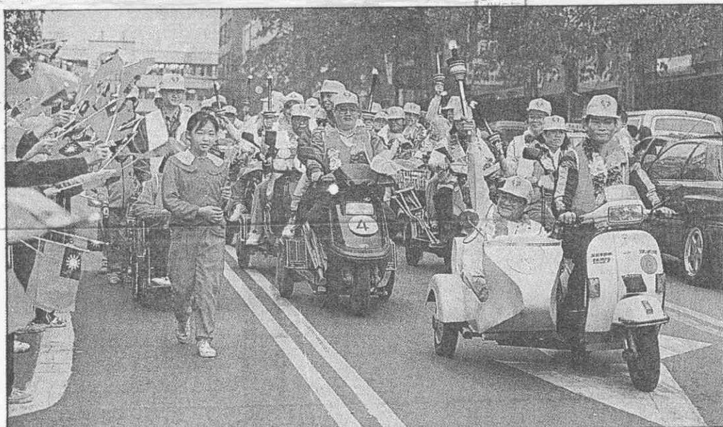
↑關愛殘障者聖火隊，昨天完成環台一周聖火傳遞，到達桃園市區，受當地民眾熱烈歡迎。