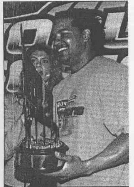
拉米瑞茲世界大賽成績