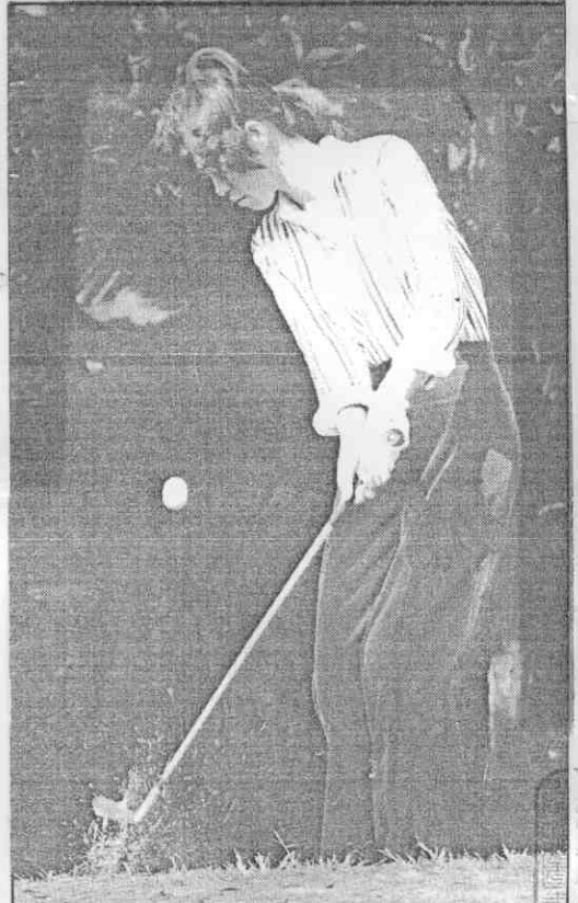
羣先領桿三十七出擊天昨月明吳將名球高子女。英